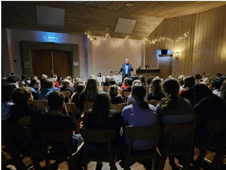
Adventviering in de grote zaal: zingen, Engelspreuk en een verhaal