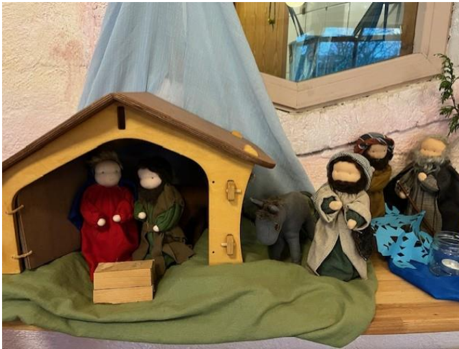
In kleuterklas 1