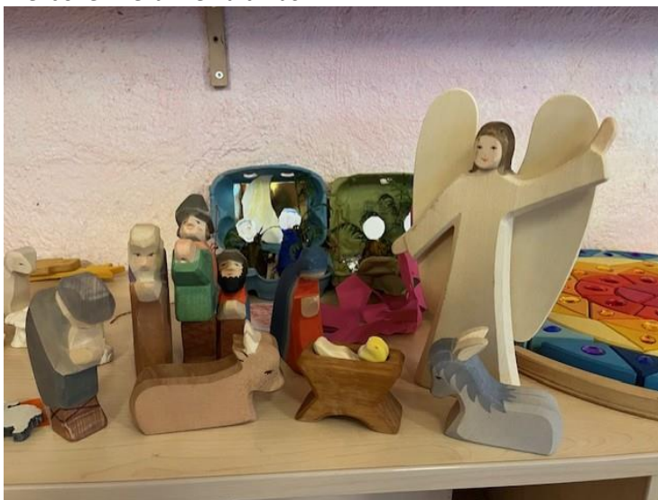
Kleuterklas 2 en klas 4