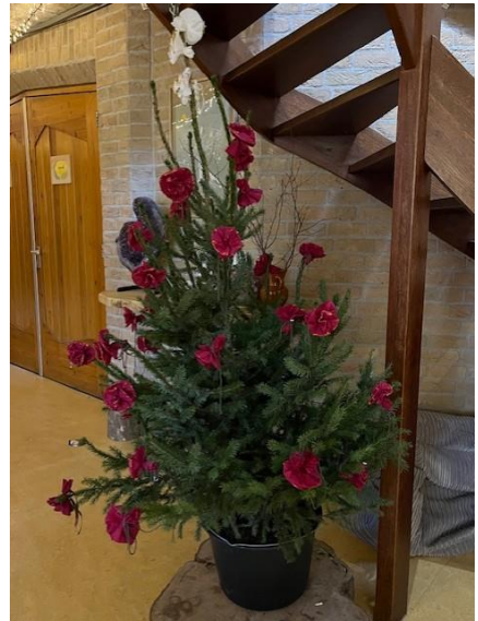
Dertig rode rozen voor de eerste levensjaren van Christus en drie witte voor zijn laatste drie jaar.