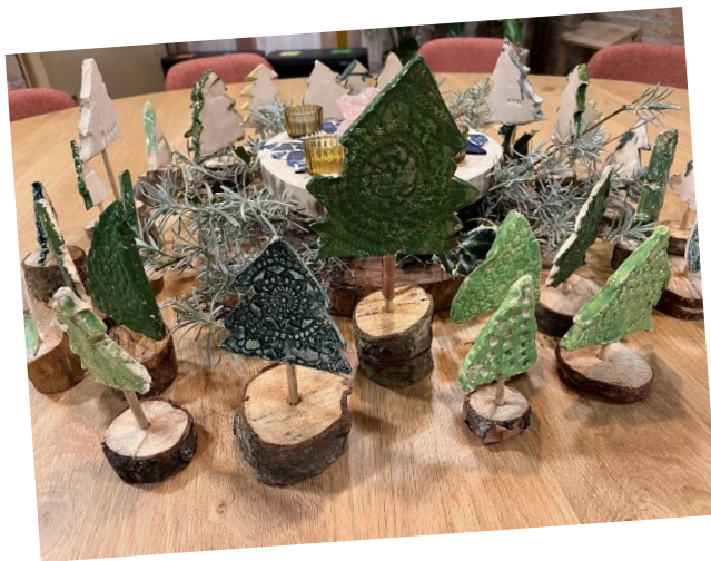
Hierboven keramiek uit klas 2