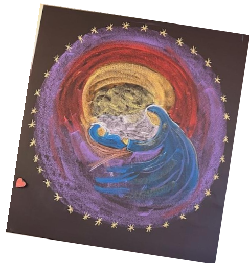
Bordtekening klas 3