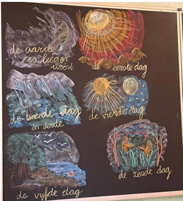
Bordtekening in klas 3